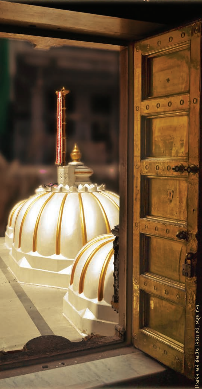
ડિઝાઇન અને લેઆઉટ: નિલેશ દવે, સ્ટેટ્સ ઈ.કે.

જૈન ધર્મ એ વિશ્વના વર્તમાન ધર્મોમાં અતિ પ્રાચીન ધર્મ છે, જે જગતભરમાં પ્રચલિત છે. તેની અહિંસા કેન્દ્રિત વિચારધારા શ્રીમદ્ રાજચંદ્ર, મહાત્મા ગાંધીજી, નેલ્સન મંડેલા, માર્ટિન લ્યુથર કીંગ જેવા મહાપુરુષોએ તેમના જીવનમાં સાર્થક કરી બતાવેલી છે અને જગત આજે પણ અહિંસાના જૈન માર્ગની અનુમોદના કરી રહ્યું છે.